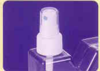
フィンガースプレー